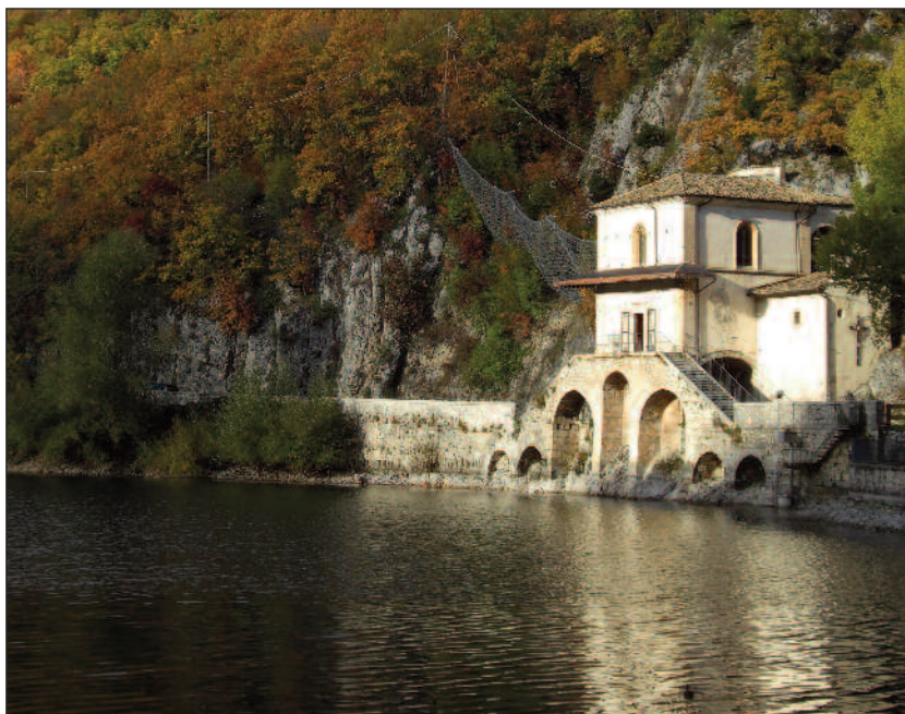
Chiesetta dell' Annunziata o Madonna del Lago (m 928) - sec. XVI.